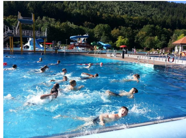
bevor er zum Kochen gebracht wird